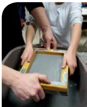
Fabrication de papier recyclé

Vous êtes une association, une école ou une collectivité et souhaitez une animation sur le thème du développement durable, contactez nous !